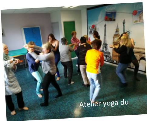
Atelier yoga du