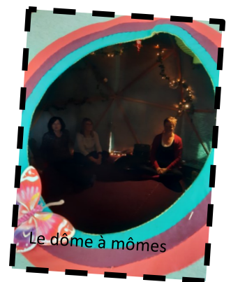
Le dôme à mômes