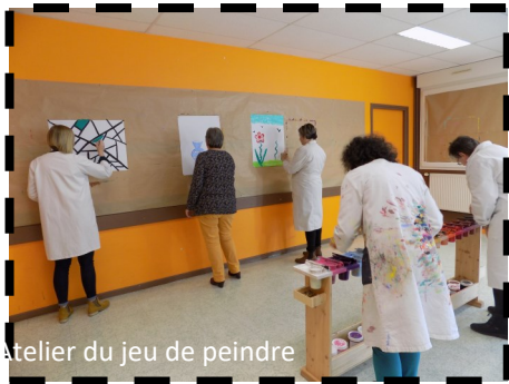
Atelier du jeu de peindre